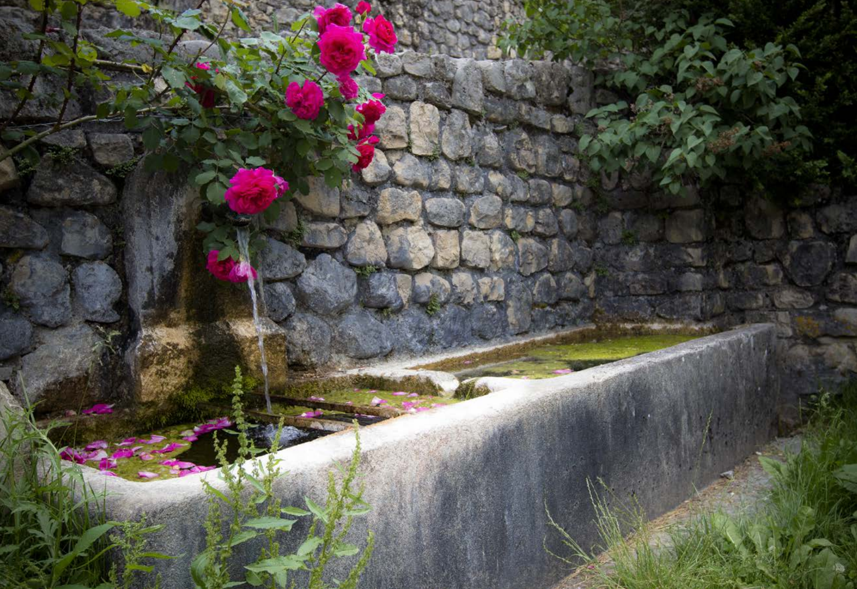
La fraîcheur d'Archiane