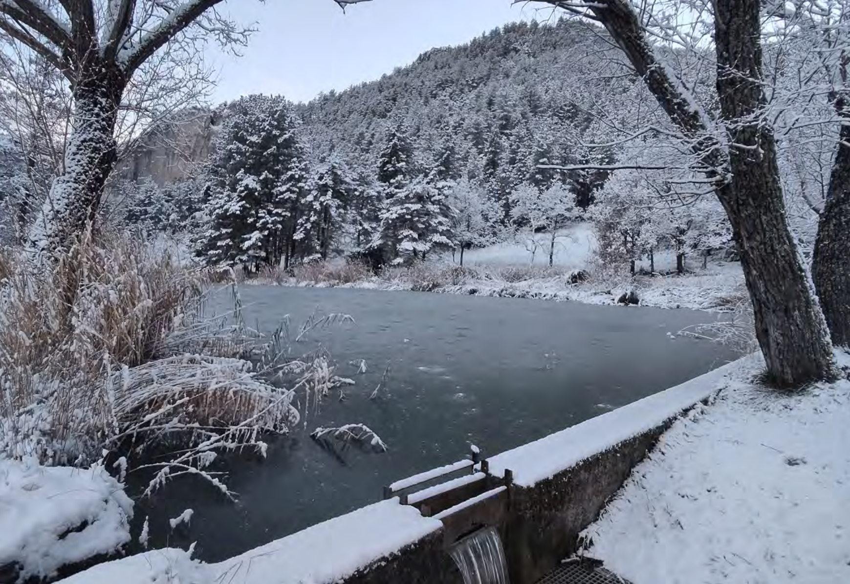
Neige sur l'étang de Beaumont-en-Diois