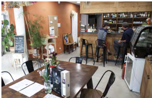
▲ Création du Bistrot Badin à St Julien-en-Quint

Une qualité d'écoute plébiscitée : 92 % des porteurs de projet sont prêts à déposer une nouvelle candidature.