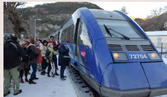
Le retour du train à Luc-en-Diois ▲

Après une phase de diagnostic, la compétence rivière et GEMAPI (Gestion des milieux aquatiques et préventions des inondations) va prendre corps sur les bassins de la Drôme, de l'Eygues et du Büech. Des programmes pluriannuels de travaux sont validés ou en préparation.