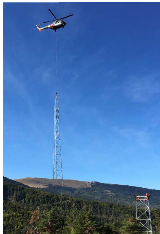
Installation du pylône de La Bâtie-des-Fonts