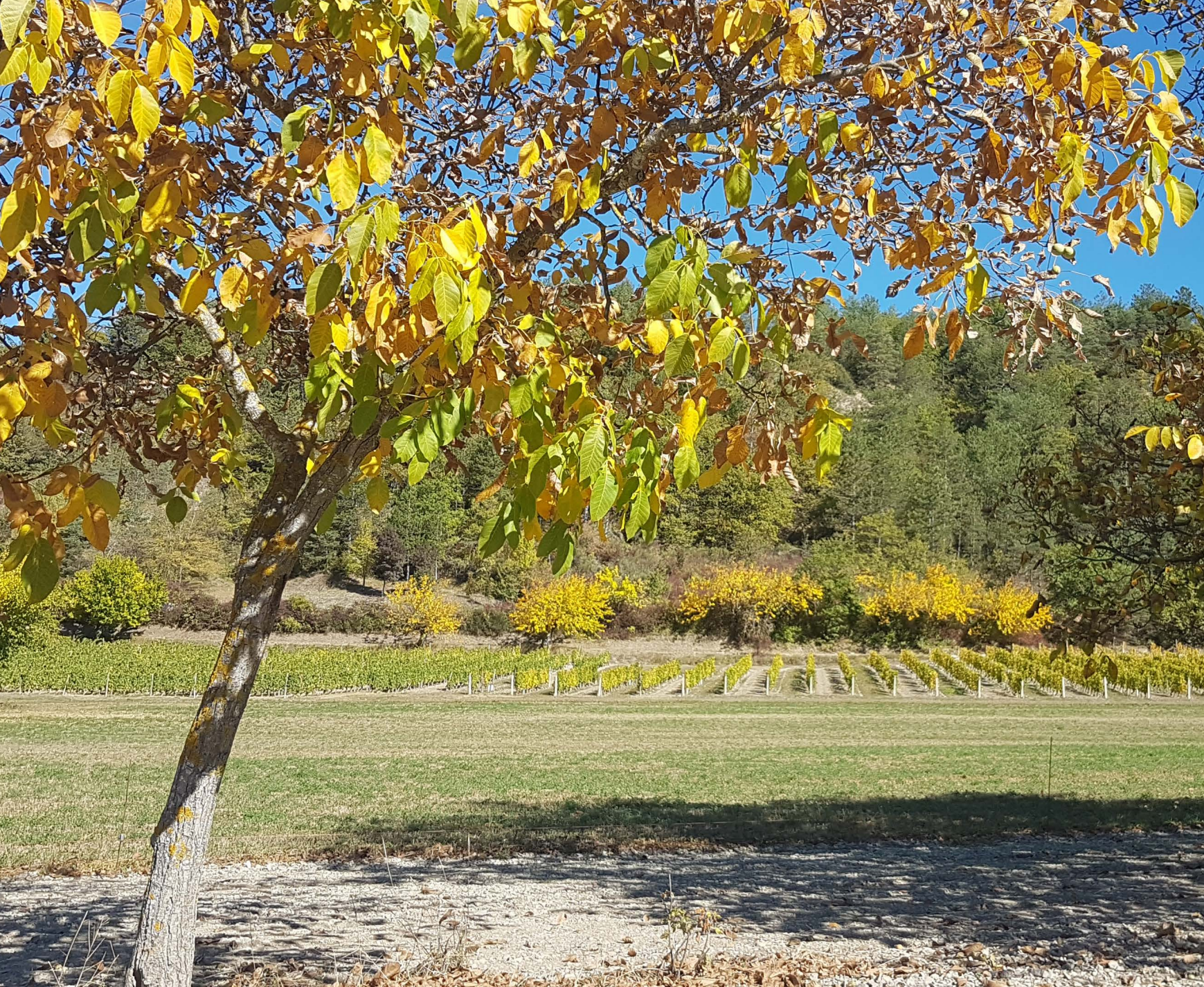
Noyers et vignes de Solaure-en-Diois

Communauté des Communes du Diois 42 Rue Camille Buffardel BP 41 26 150 DIE